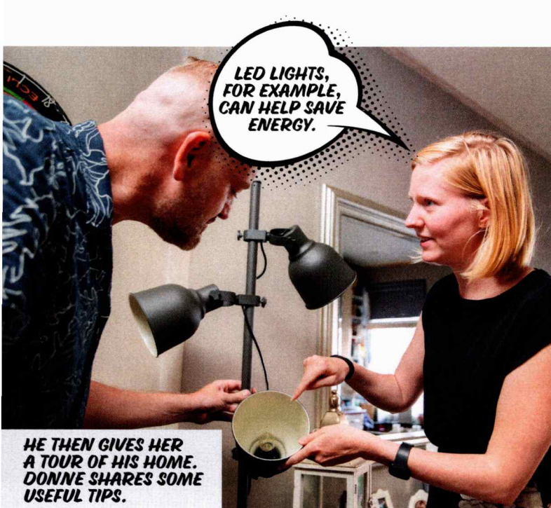
HE THEN GIVES HER A TOUR OF HIS HOME. DONNE SHARES SOME USEFUL TIPS.